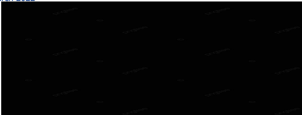
Event : Donated care bag of covid situation to community by MTN team Date: 2 Feb 2022