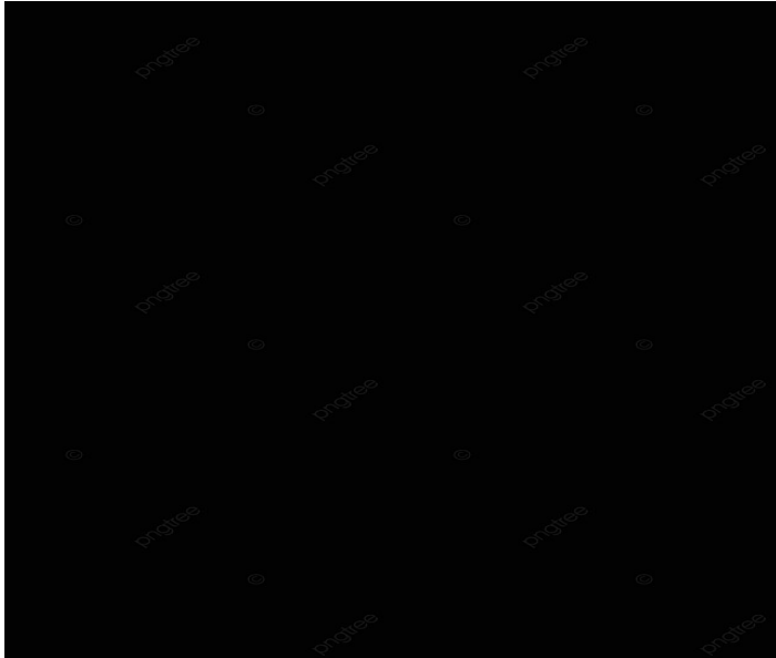
Event : Donated Oxygen concentrator 6 hospital at Rayong and BKK Date: March 2022