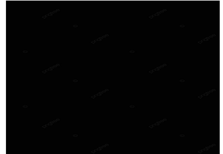
Event : Donated survival box to community at Rayong and BKK Date: March 2022